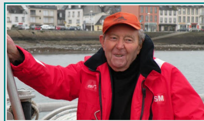
«Rester humble devant la mer»